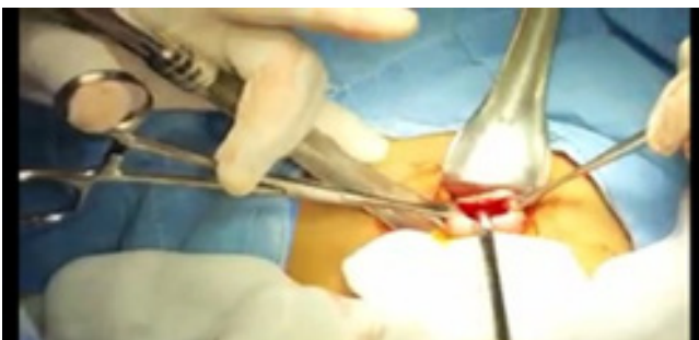
Figura 2. Extracción de cuerpo extraño por cirugía.

Se realiza el día 11.03.23 extracción de cuerpo extraño encontrándose bolígrafo de aproximadamente 12 cm de largo y 0.7 cm de diámetro (Figura 2, 3).