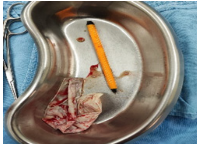
Figura 3. Cuerpo extraño.

Paciente con adecuada evolución con egreso a domicilio por mejoría clínica y seguimiento por parte del servicio de psiquiatría.