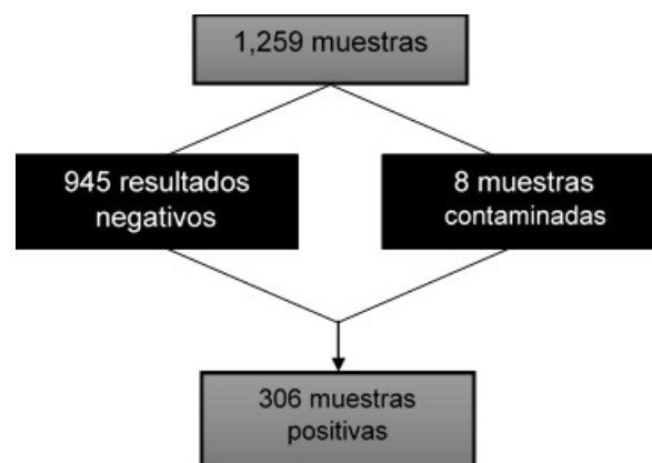
Figura 1. Diagrama de flujo de la selección de muestras.

Se utilizó un muestreo no probabilístico de casos consecutivos. No se realizó un cálculo de tamaño de muestra estadístico debido a que se incluyó el universo total de urocultivos procesados en el laboratorio durante el periodo de estudio (n=1,259). De este total, se excluyeron 945 resultados negativos y 8 muestras contaminadas, con lo que se obtuvo una muestra final de 306 aislados positivos (Figura 1).