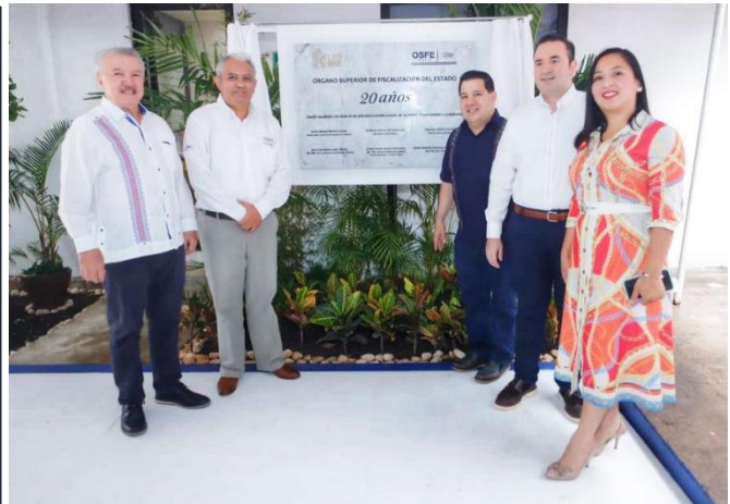
Foto. Placa Conmemorativa de los 20 años de creación del OSFE.

El resultado de la planeación y ejecución de la fiscalización se plasman en los Informes de Resultados de las Cuentas Públicas 2022 , que, además contienen los criterios de selección, objetivo, alcances, procedimientos de auditoría aplicados, observaciones, recomendaciones, acciones, adeudos y toda aquella información en general, conforme a lo establecido en el artículo 34, de la Ley de Fiscalización Superior del Estado de Tabasco (LFSET); con respecto a los resultados finales y observaciones preliminares de las auditorías de cumplimiento con enfoque financiero y técnico, así como las del desempeño