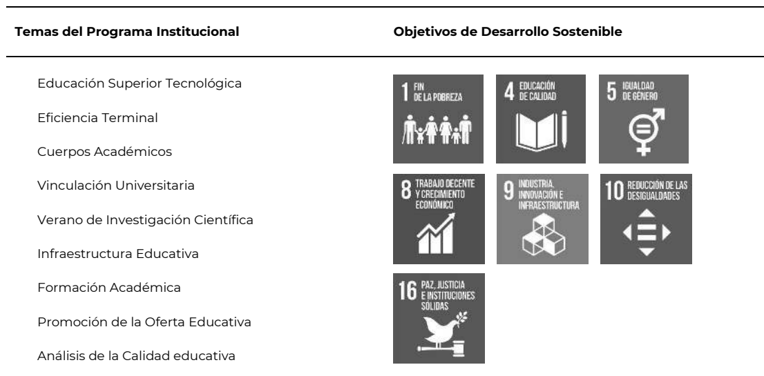
Tabla 1. Alineación de los Temas del Programa Institucional de la Universidad Tecnológica del Usumacinta 2025-2030 con los Objetivos de Desarrollo Sostenible

Fuente: Elaboración propia con base en los Objetivos de Desarrollo Sostenible.