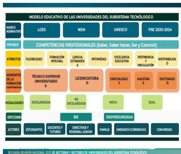
Figura 1. Modelo Educativo de las Universidades del Subsistema Tecnológico. Dirección Académica de la DGUTyP