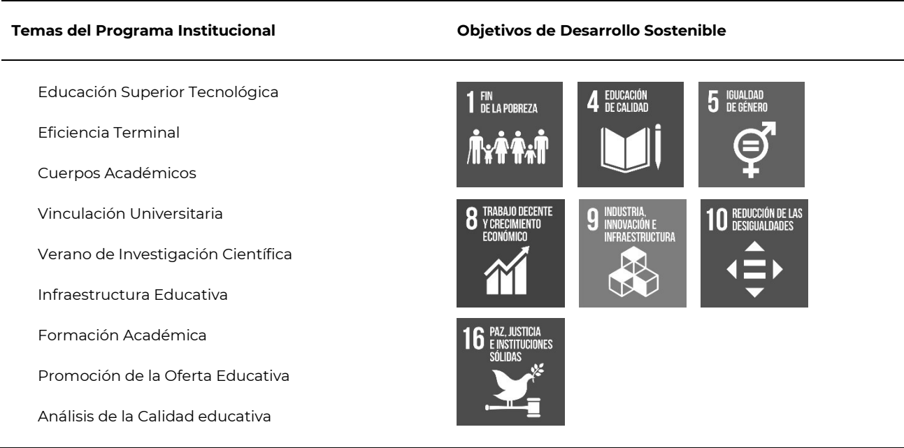
Tabla 1. Alineación de los Temas del Programa Institucional de la Universidad Tecnológica del Usumacinta 2025-2030 con los Objetivos de Desarrollo Sostenible

El marco teórico y metodológico del Plan Institucional de Desarrollo de la Universidad Tecnológica del Usumacinta (UTU) debe orientarse hacia la mejora continua, la adaptación a las necesidades regionales y nacionales, y el fortalecimiento de la calidad educativa. A través de un diagnóstico exhaustivo, la definición de objetivos claros, la implementación de estrategias eficaces, y un sistema de evaluación y retroalimentación, el PIDE 2025-2030 puede ser una herramienta clave para el desarrollo y crecimiento de la institución, contribuyendo al avance de la región del Usumacinta y al bienestar social.