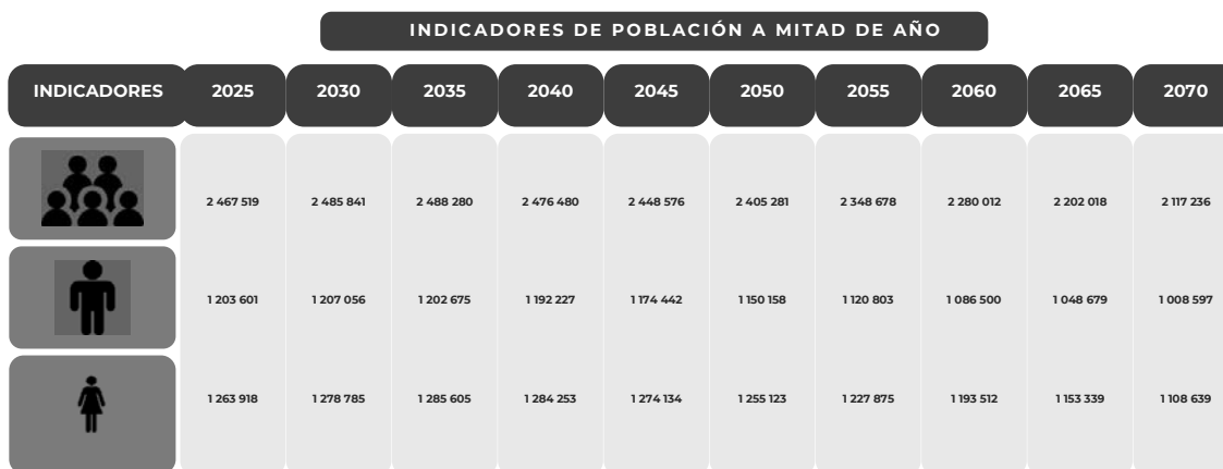
Figura 1. Tabasco: Indicadores Demográficos