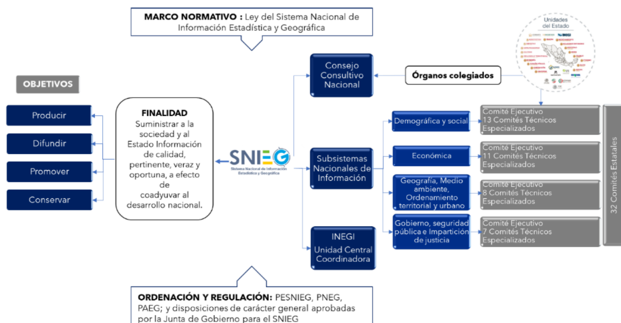
Figura 1. Estructura y Composición del SNIEG