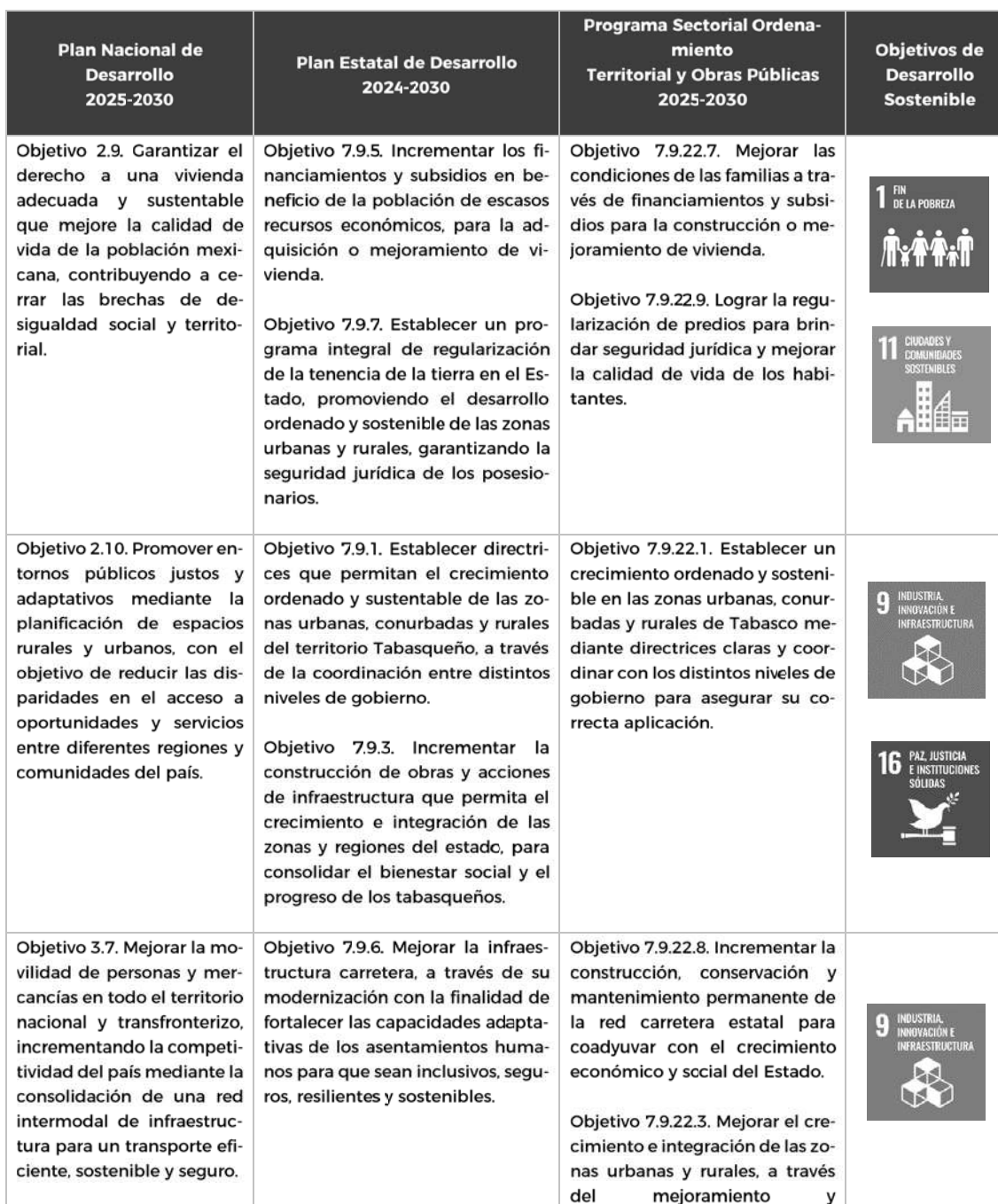
Tabla 1. Alineación del Programa Sectorial Ordenamiento Territorial y Obras Públicas 2025-2030 con el PND 2025-2030, el PLED 2024-2030 y los Objetivos de Desarrollo Sostenible