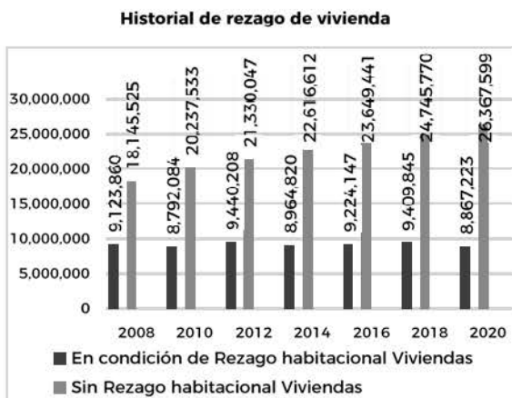
Gráfica 1. Condición de las Viviendas en México 2008-2021

Fuente: Comisión Nacional de Vivienda, con base en datos del SNIIV, 2021