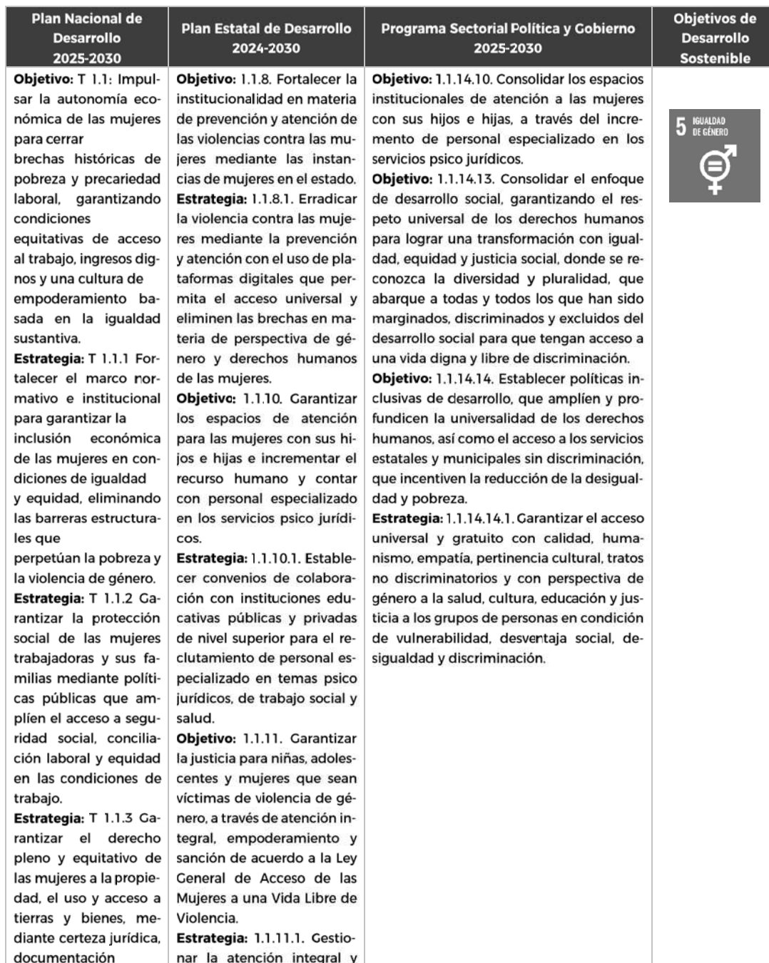
Tabla 1. Alineación del Programa Sectorial Política y Gobierno 2025-2030 con el PND 2025-2030, el PLED 2024-2030 y los Objetivos de Desarrollo Sostenible