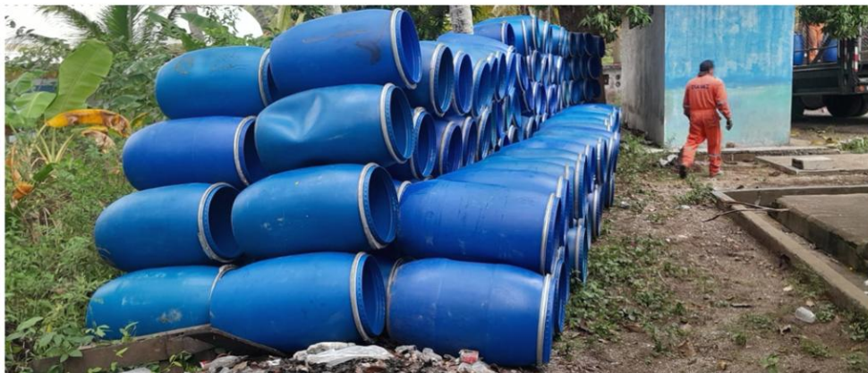
Figura 5. Material parte del apoyo de paquete tecnológico, el cual fue vigilado y contado por el Comité de Contraloría Social, Programa Pescaando Vida, Ejido Alacrán, y Alacrán Manatiner, Cárdenas, Tabasco, dar fe del material entregado por el proveedor.