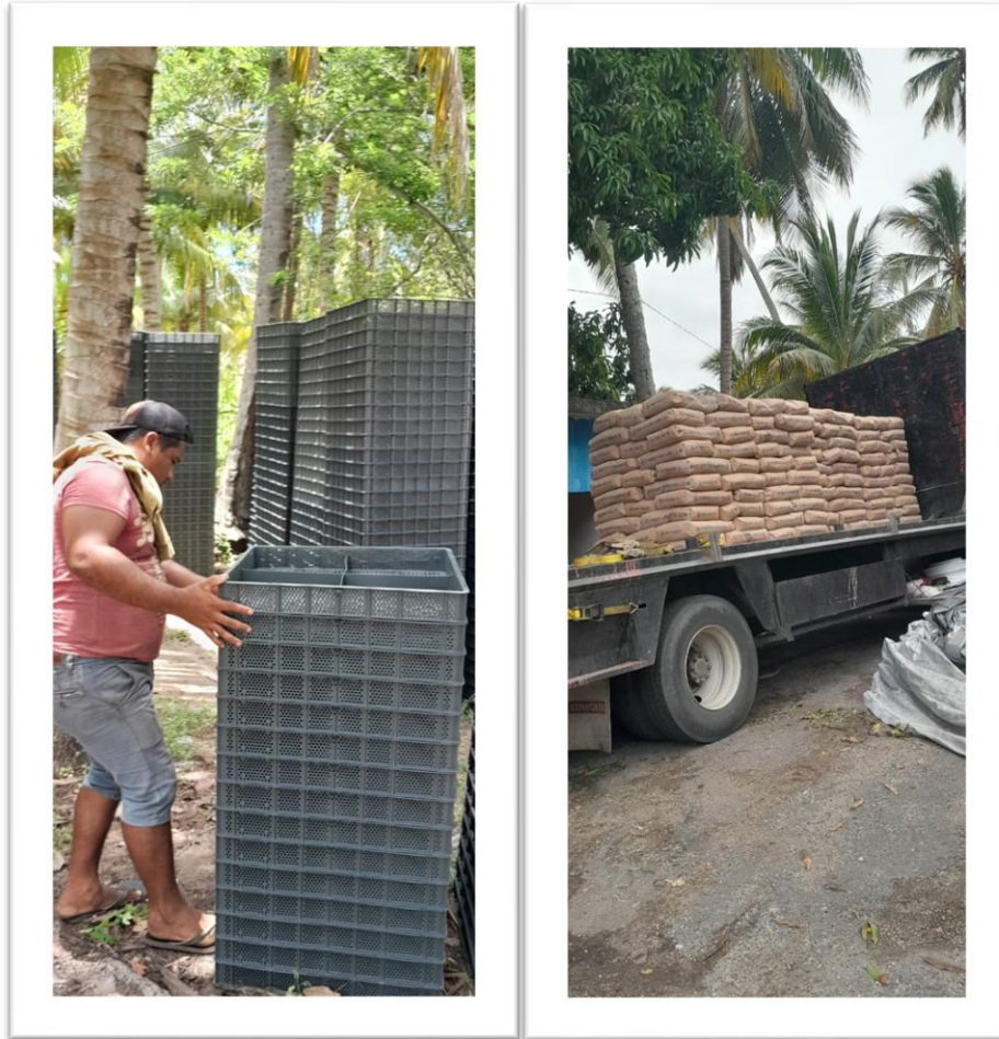
Figura 4. Se observa el trabajo de vigilancia y conteo del Comité de Contraloría Social, Programa Pescando Vida, Ejido Alacrán, y Alacrán Manatintero, Cárdenas, Tabasco, dar fe del material entregado por el proveedor.

El 02 de julio se continuo con los trabajos de recepción de material, se recibió el resto de cajas ostrícolas 4500, las 200 boyas, 300 tambos, y 300 bultos de arena de igual forma representantes de CAA, junto con el comité de contraloría social continuamos nuestras funciones correspondientes, conteo de cajas ostrícolas y acomodo en paquetes de 180, conteo de boyas y conteo de tambos. (duración 5 hrs)