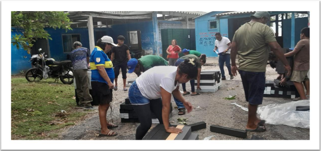
Figura 2. Actividad de vigilancia y conteo del Comité de Contraloría Social, Programa Pescaando Vida, Ejido Alacrán, y Alacrán Manatinero, Cárdenas, Tabasco

El día 26 de junio se inició con la recepción de material en donde el técnico de SEDAP en conjunto con los representantes de CAA y el comité de Contraloría Social supervisaron y realizaron el conteo de 12000 flotadores entregados por el proveedor, los cuales fueron agrupados en paquetes de 60 flotadores (la dotación para cada beneficiario fue de 120), el Comité de Contraloría Social (CCS) conto, anoto y dio fe del material entregado y de los 2 paquetes de 60 flotadores que le tocarían a cada beneficiario el día de la entrega formal. Cabe mencionar que todo el equipo participo en dicha actividad para poder verificar físicamente que estuviera completa la entrega por parte del proveedor.