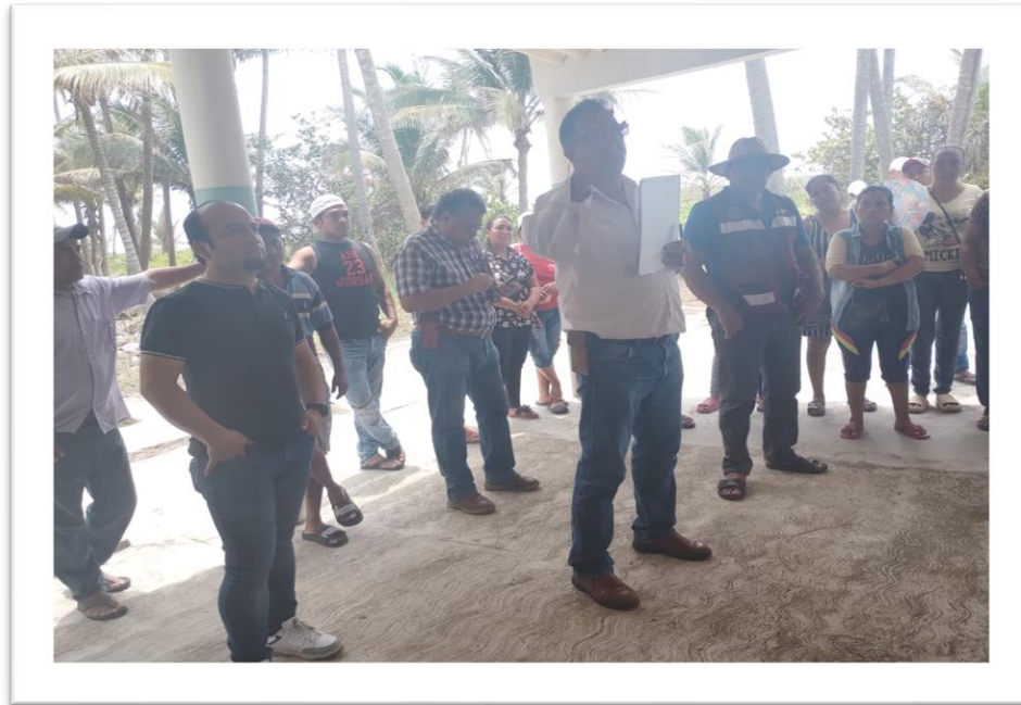
Figura 1. Capacitación sobre contraloría social, Ejido Alacran/Manatinero