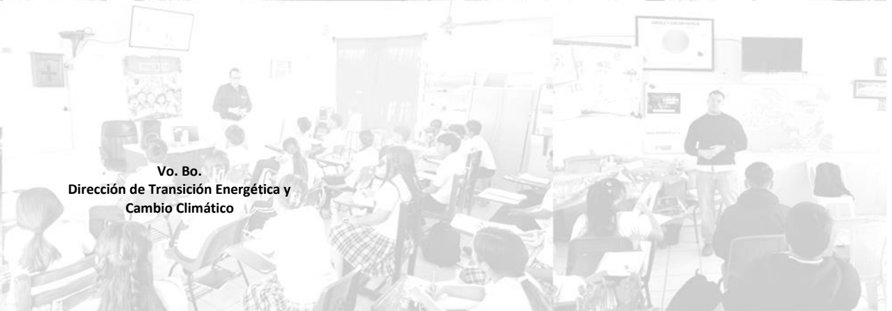
Vo. Bo. Dirección de Transición Energética y Cambio Climático