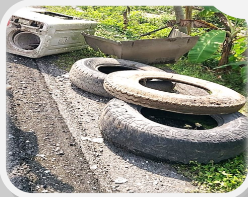
DESCACHARRIZACION EJIDO LA CEIBA 1RA SECC, HUIMANGUILLO TABASCO, 5 DE OCTUBRE 2023