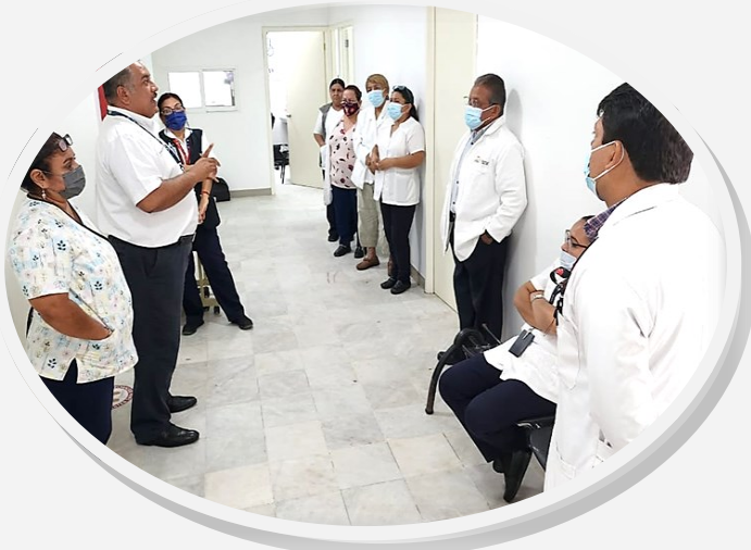
PLÁTICA CON PERSONAL DE PRIMER NIVEL DE ATENCION