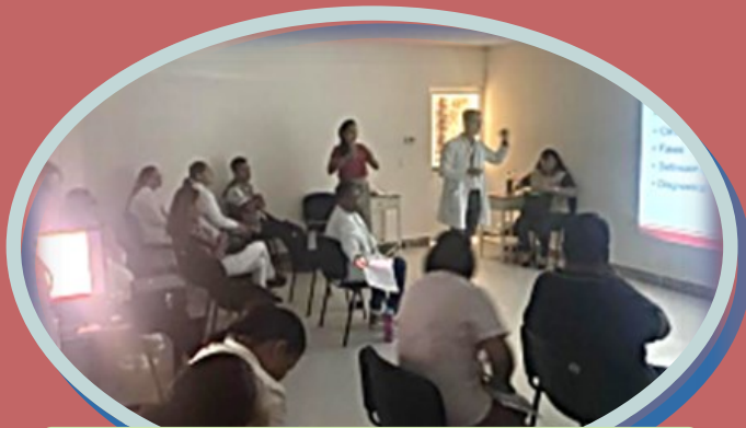
Capacitación de Dengue al Staff

El paludismo o malaria, es una enfermedad febril aguda provocada por parásitos del género Plasmodium que se propagan a las personas a través de la picadura de mosquitos del género Anopheles hembra infectados. Se trata de una enfermedad prevenible y curable.