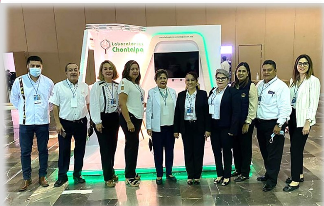
Apoyo logístico del evento, con personal de la Dirección de Calidad y Educación en Salud, Septiembre 2022.