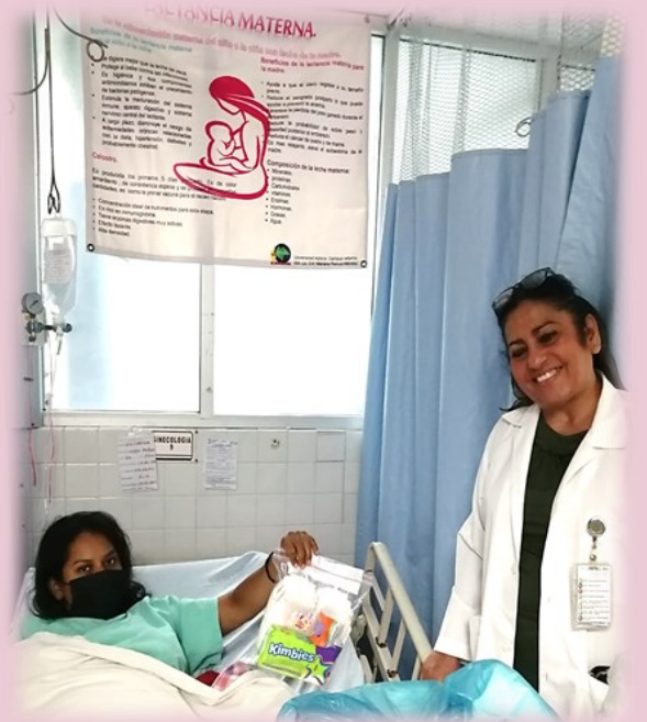
Pacientes se egresan con OTB y colocación de DIU (se obsequia un kit de artículos para el recién nacido)