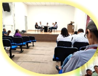
DIA DEL PSICOLOGO