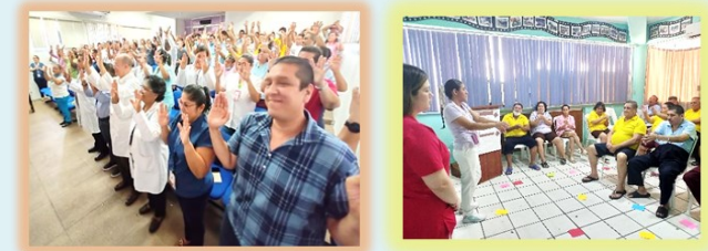
6 de Mayo - Participación del personal del turno