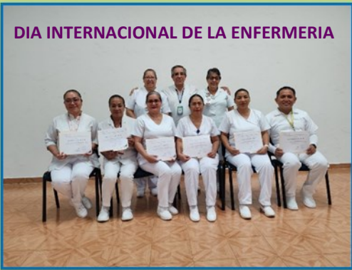
DIA INTERNACIONAL DE LA ENFERMERIA

En el marco del Día Nacional e Internacional de la Enfermería , se realizó una ceremonia alusiva en el Hospital Regional de Alta Especialidad de Salud Mental Villahermosa.