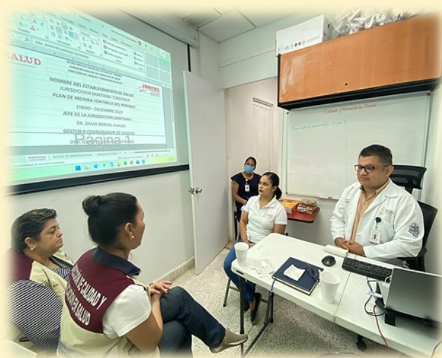
HOSPITAL GENERAL TENOSIQUE