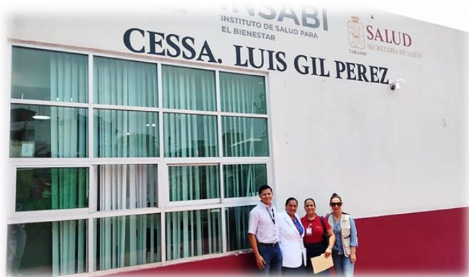
CESSA LUIS GIL PEREZ

En el periodo junio-julio se visitaron 7 CESSAS de la Jurisdicción de Centro: Dr. Maximiliano Dorantes, Tamulté Delicias, Tierra Colorada, Gaviotas, La Manga, Luis Gil Pérez, Yokot'an, así como la Jurisdicción y Hospital de Tenosique, teniendo como resultado el establecimiento de acuerdos para el cumplimiento de las actividades que exige la Federación, y personal capacitado en los procesos de calidad.