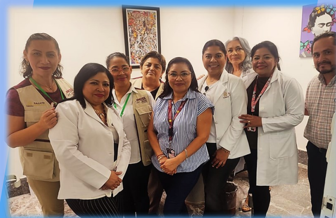
SUPERVISION HOSPITAL JUAN GRAHAM

Como resultado, se generaron acuerdos y compromisos para la mejora continua de los procesos de calidad en salud.