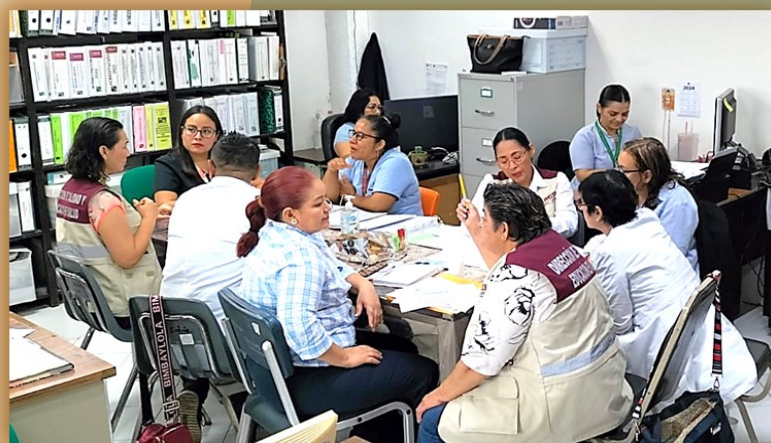
SUPERVISION HOSPITAL DEL NIÑO

En este año, la DCES a través del Departamento de Mejora Continua de la Calidad lleva a cabo el Plan de Implementación de los Comités de Calidad y Seguridad del Paciente (COCASEP) con el objetivo de garantizar la instalación de los Comités en cada uno de los establecimientos de atención médica de la Secretaría de Salud del Estado, y vigilar el cumplimiento de los acuerdos que se establecen para el desarrollo de acciones de mejora continua por la calidad y seguridad del paciente.