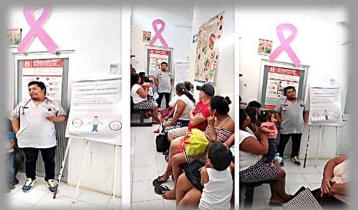
C.S. MEDELLIN Y MADERO 2DA.

Cada año el 24 de marzo, se conmemora el Día Mundial de la Tuberculosis (TB) para concientizar a la población sobre las devastadoras consecuencias sanitarias, sociales y económicas de la TB, a fin de intensificar los esfuerzos para acabar con esta epidemia mundial. La fecha conmemora el día en el que el Dr. Robert Koch anunció que había descubierto la bacteria que causa la tuberculosis en 1882, lo que abrió el camino hacia el diagnóstico y la cura de esta enfermedad.