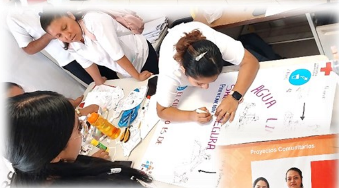
Personal de la Cruz Roja facilitador del tema.