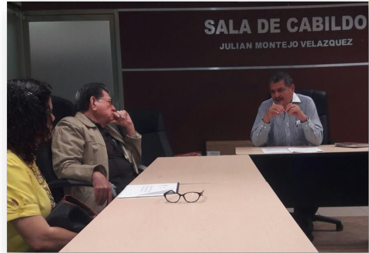
Cárdenas Secretario del Ayuntamiento