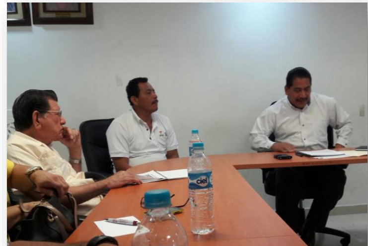
Jalpa de Méndez