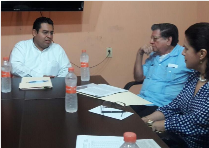
Macuspana Secretario del Ayuntamiento