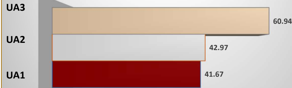
Porcentaje de aciertos por unidades de análisis (Zona)