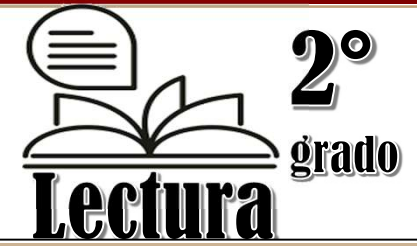
Reactivos por unidad de análisis