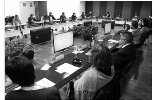
Convocan SEP y Mejoredu a articular propuestas para la mejora de la educación

Se coincidió que, de esta manera, esta sinergia se constituya como la oportunidad de poder crear y mejorar, en este momento histórico que se plantea, y que debe de ser aprovechado.