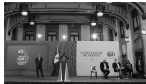
Boletín no. 178 Respaldan instituciones nacionales e internacionales la decisión de regresar a clases presenciales

En este sentido, la secretaria de Educación dijo que trabaja con el Fondo de las Naciones Unidas para la Infancia (Unicef), la Secretaría de Gobernación y la Comisión de Derechos Humanos de la Ciudad de México, para desarrollar varias acciones para el regreso a clases.