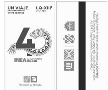
Boletín SEP no. 185 Reconoce el Metro de la Ciudad de México labor del INEA en sus 40 años de servicio

El boleto conmemorativo tiene un tiraje de 7 millones, y está en circulación desde el pasado lunes 23 de agosto en todas las taquillas del Metro.