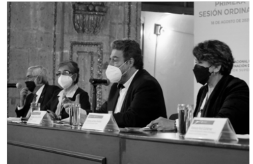
Boletín SEP no. 176 Cumple Conaces con una deuda histórica del Estado a las comunidades de Educación Superior: Delfina Gómez

Al encabezar la instalación y la Primera Sesión Ordinaria del Conaces, en el salón Iberoamericano de la SEP, Gómez Álvarez destacó la relevancia histórica fundamental de este acto, porque apuntala a la Educación Superior como elemento fundamental en su transformación y el bienestar de la población.