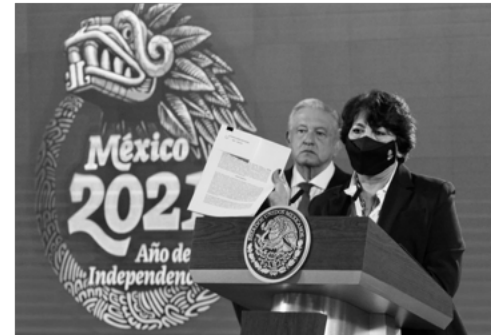
El regreso a clases es un acto de corresponsabilidad que compete a todos: SEP

Durante la conferencia matutina en Palacio Nacional, encabezada por el presidente Andrés Manuel López Obrador, dijo que la SEP no puede detenerse en otorgar el servicio educativo, porque es un derecho establecido en la Constitución para niños y niñas, lo cual también lleva a respetar el derecho a la salud.