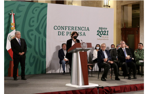
Regreso voluntario a clases presenciales a partir del 7 de junio: Educación

AUDIO - https://n9.cl/1rj1h ( https://n9.cl/1rj1h )