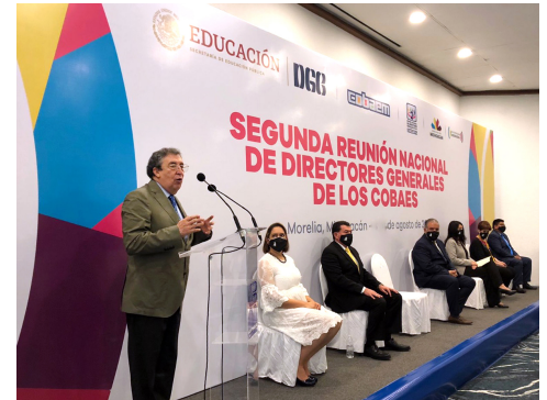
Escuelas deben ser ejemplo para que la sociedad tenga mejores condiciones de seguridad sanitaria

Al respecto, la titular de la Secretaría de Educación Pública (SEP), Delfina Gómez Álvarez, consideró que, aunque los aprendizajes no se detuvieron durante la pandemia, el regreso a las escuelas es muy importante y necesario, ya que las y