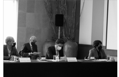
Presenta SEP servicios para fortalecer la atención educativa de los mexicanos en el exterior y en retorno

Para garantizar el derecho constitucional a la educación de las y los mexicanos en el exterior, el Gobierno de México a través de la Secretaría de Educación Pública (SEP), dio a conocer EDUCATEL Migrante y el sitio de internet Mexterior, los cuales darán servicio a las y los mexicanos en el exterior y aquellos que desean regresar al país, donde podrán consultar información relevante y actualizada sobre la oferta y servicios educativos.