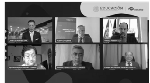
Inaugura Conalep Coloquio Internacional Perspectivas y Consolidación de la Formación Dual