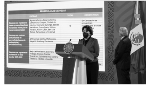
Continúan las clases presenciales en 14 estados del país: Educación

Abundó que ya son seis los estados con Centros Comunitarios de Aprendizaje: Chihuahua, Colima, Michoacán, Nayarit, Sinaloa y Zacatecas; en tanto que son 11 entidades las que regresarán a clases en el ciclo escolar 2021-2022: Baja California Sur, Guerrero, Hidalgo, Oaxaca, Puebla, Querétaro, Quintana Roo, Sonora, Tabasco, Tlaxcala y Yucatán.