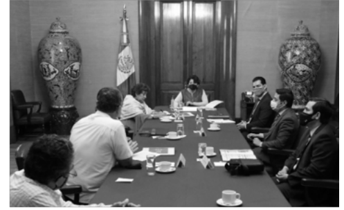
Revisan SEP y la Confederación Nacional de Escuelas Particulares acciones y recomendaciones sanitarias en el regreso a clases presenciales

Igualmente, Delfina Gómez Álvarez instruyó a su equipo de trabajo a reforzar los canales de comunicación con las organizaciones educativas particulares y a favorecer el intercambio de contenidos en materia de capacitación, con el propósito de que las comunidades escolares de esas escuelas puedan acceder a los contenidos que ofrece la dependencia federal.