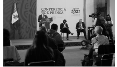
Inmunización continúa de acuerdo con la estrategia del Grupo Técnico Asesor de Vacunación (GTAV).

Indicó que de acuerdo con el criterio epidemiológico que se sintetiza con el semáforo de riesgo COVID-19 de las últimas tres semanas, se estableció el calendario para vacunar del 20 de abril al 28 de mayo a 3.3 millones de personas del sector educativo público y privado a nivel nacional, con la vacuna CanSino, que es de una dosis y no necesita ultracongelación.