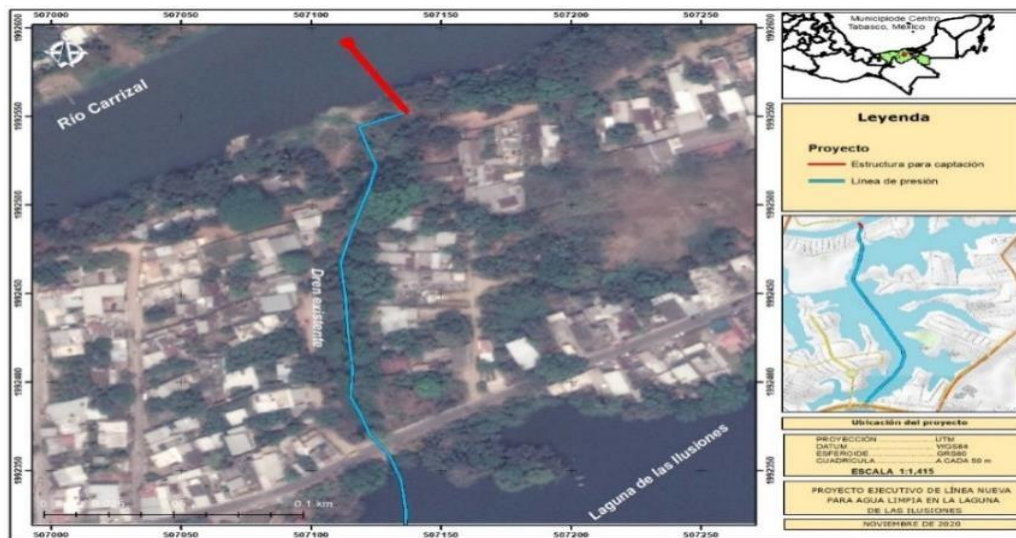
Figura Sitio seleccionado para la instalación de la línea nueva de agua limpia.

Esta obra es complementaria a una estructura, y está conformada por una plataforma de bombeo (succiona agua de forma directa), sistemas de bombeo (bombas verticales interconectadas) y un puente tubular hincado sobre la margen del río Carrizal.