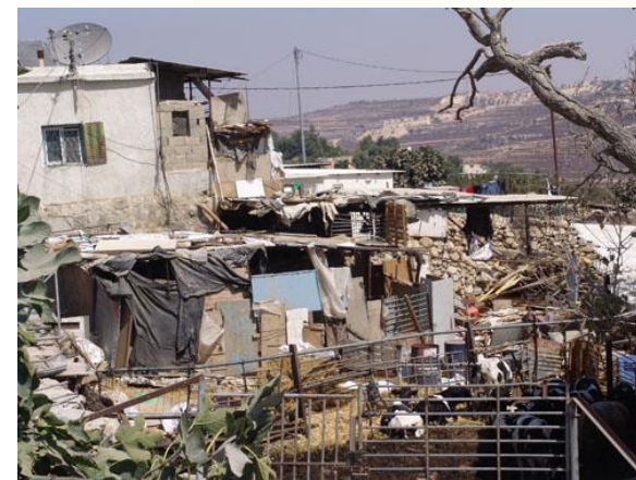
Hacinamiento y asentamientos informales