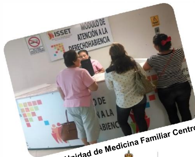
Unidad de Medicina Familiar Centro