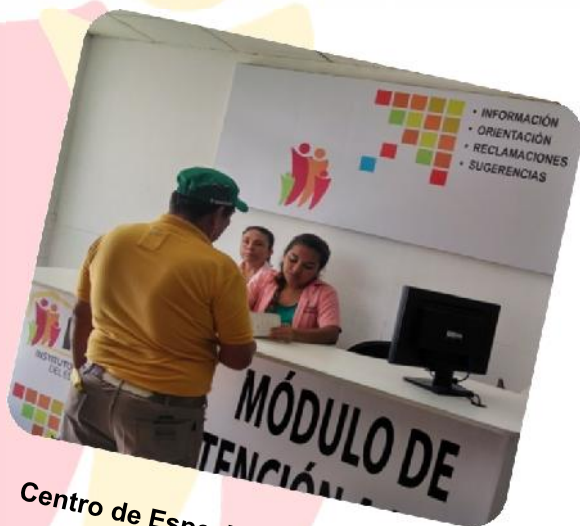
Centro de Especialidades Médicas