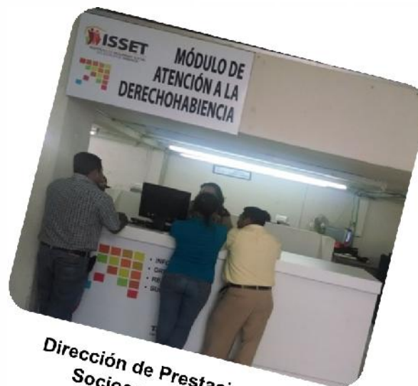
Dirección de Prestaciones Socioeconómicas