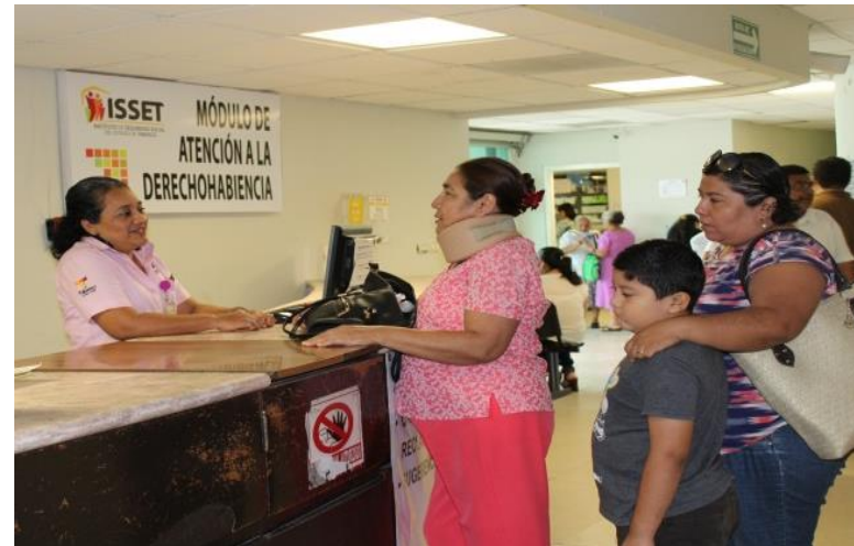
UMF DE CENTRO