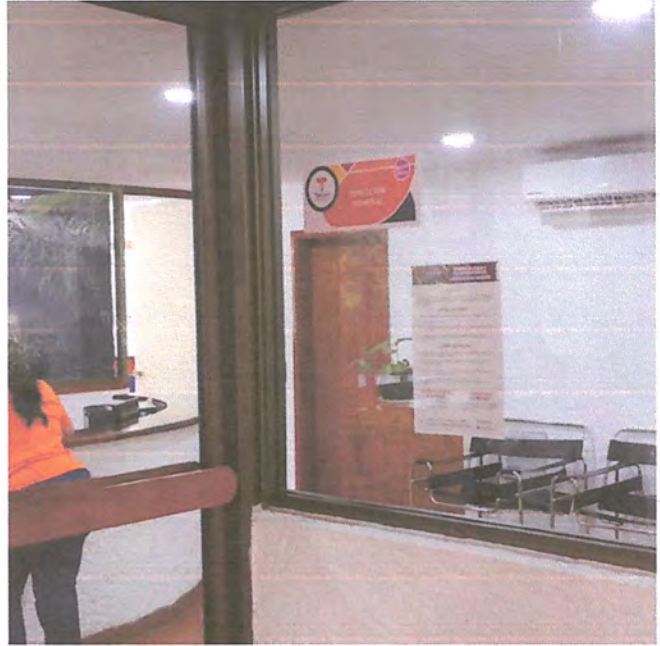
Colocación en diferentes unidades administrativas