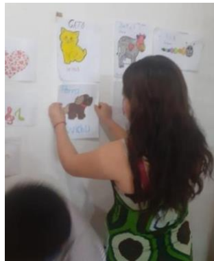
Traductora de lengua