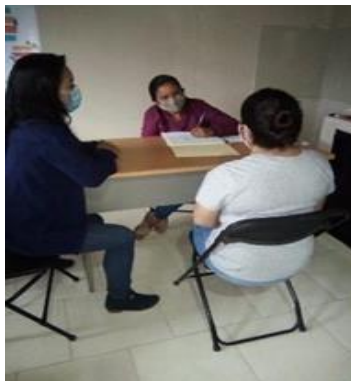
Servicio de traductora de lengua