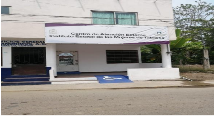
Fachada del Centro de Atención Externa