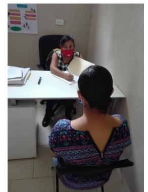
Servicio de asesoría psicológica a usuarias