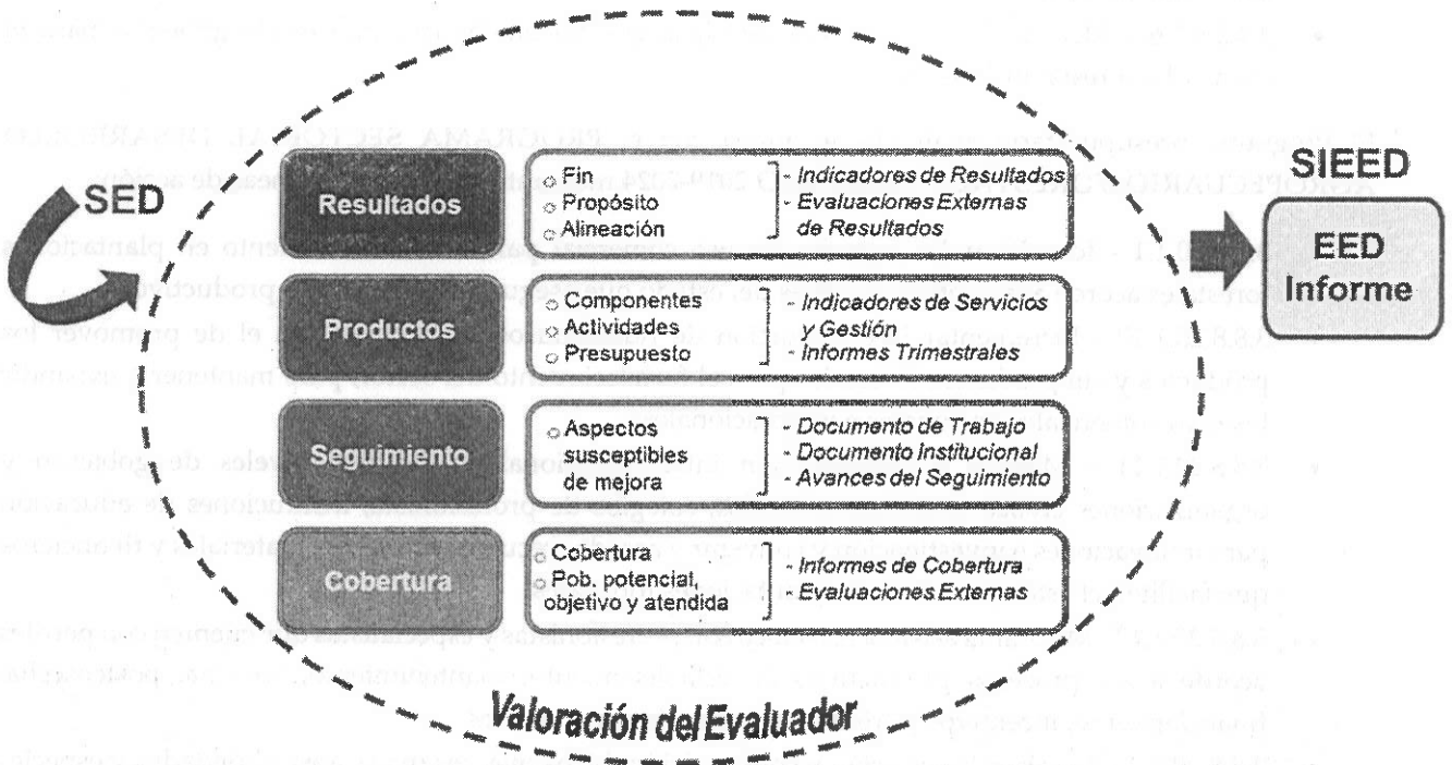
Figura 1. Esquema General para la Valoración Global del Desempeño del Programa Presupuestario.