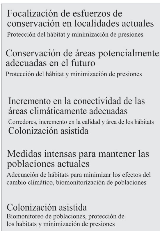
Figura 4. Marco teórico para guiar la selección de estrategias de conservación en función de los determinantes de vulnerabilidad de cada especie. Modificado de Arribas et al. (2012).