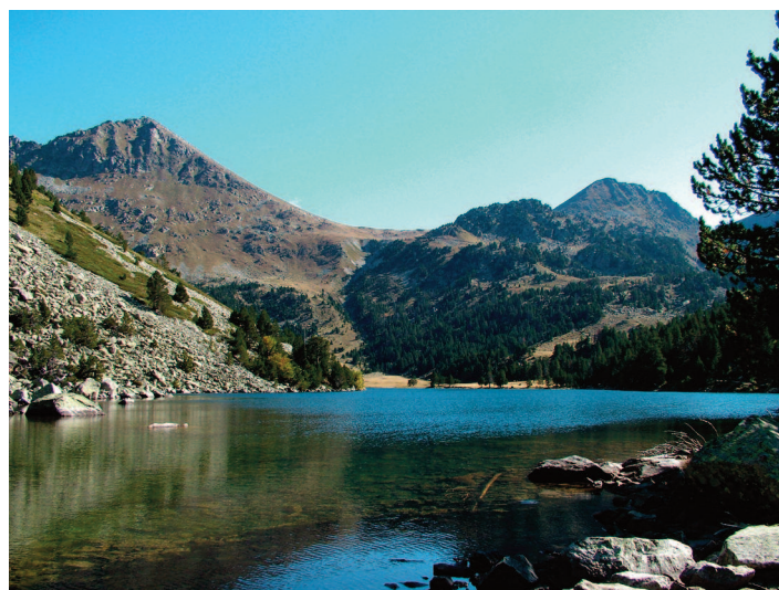
Figura 3. Parque Nacional de Aigüestortes i Estany de Sant Maurici, que verá disminuida su área de representatividad climática en más de un 95 %, y por tanto uno de los espacios protegidos donde la incorporación de estrategias para mitigar los efectos de cambio climático en las especies es más urgente.

A pesar de la utilidad de los modelos de distribución, si las evaluaciones de la vulnerabilidad de las especies ante el cambio climático se basan sólo en estimar dónde se encontrarán las condiciones climáticas adecuadas para las mismas en el futuro, se podría subestimar su verdadera capacidad de persistencia en sus emplazamientos actuales. Por otro lado, estas evaluaciones también pueden sobrestimar la capacidad real de las especies para dispersarse y acceder a las nuevas regiones con condiciones futuras adecuadas, ya que aunque las especies tengan mayor espacio con clima adecuado en el futuro, este puede ser inaccesible para aquellas con escasa capacidad de dispersión (Pearson y Dawson 2003; McMahon et al. 2011). Además de las fuentes de incertidumbre mencionadas, las valoraciones de la vulnerabilidad ante el cambio climático basadas exclusivamente en modelos de