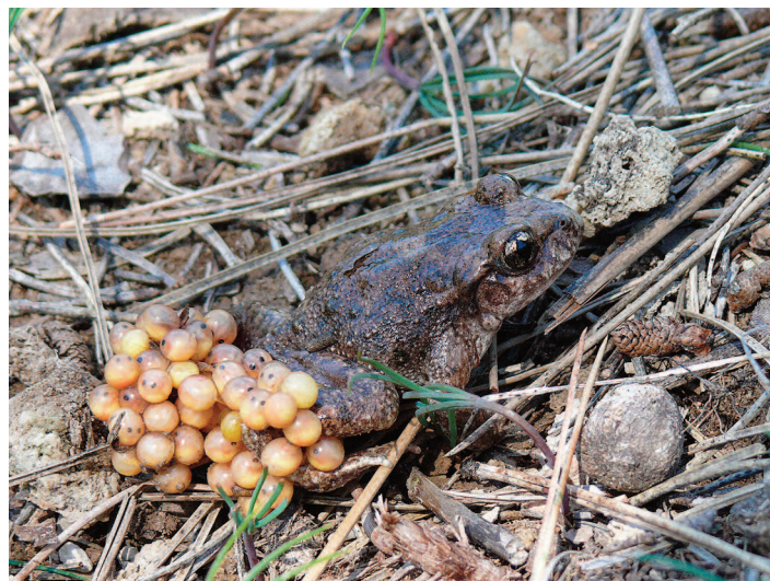
Figura 2. Sapo partero bético ( Alytes dickhilleni ), endemismo Ibérico catalogado como "Vulnerable" por la IUCN. Los modelos predicen una pérdida sustancial de las condiciones climáticas adecuadas para esta especie en su rango de distribución actual (ej. ver Lobo et al. 2011 y Araújo et al. 2011a). Dicha reducción junto a su limitada capacidad de dispersión podría incrementar significativamente su riesgo de extinción, especialmente en el sur de la Península Ibérica.

En general, las regiones colindantes a los Parques Nacionales podrían presentar en el futuro condiciones similares a las que actualmente tienen éstos y, por tanto, podrían ser receptoras potenciales de gran parte de la biodiversidad que actualmente albergan estos espacios protegidos. El cambio climático puede provocar que cada espacio protegido sea receptor en el futuro de fauna y flora que, actualmente, encuentra condiciones favorables en otros territorios y, a la vez, actúe como "emisor" de otras especies. Debido a ello, es urgente y prioritario realizar un manejo integrado de la red de espacios protegidos y sus áreas adyacentes, adecuando además los planes de gestión de cada uno de ellos a fin de vigilar, facilitar y adaptar su jurisdicción a las nuevas presiones y cambios que se avecinan. La delimitación de nuevas áreas con potencial para actuar como "corredores ecológicos", el manejo racional y sostenible del conjunto del territorio y la elaboración de estrategias de adaptación basadas en evidencias científicas deberían ser la norma de actuación si queremos conservar la biodiversidad Ibérica ante el cambio climático.